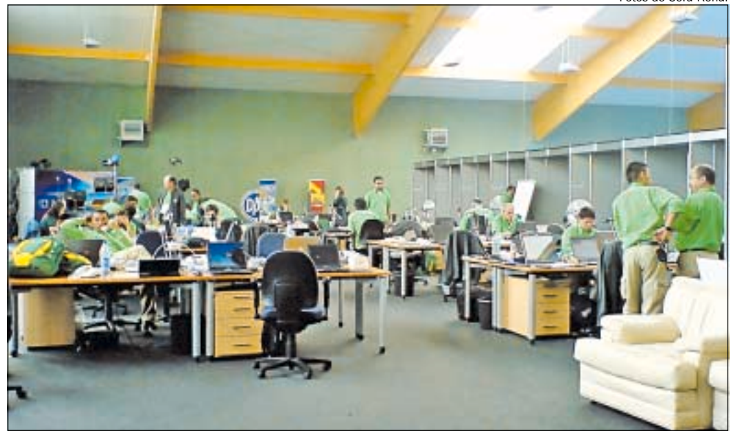
A REDAÇÃO da Globo: uma operação de guerra impressionante, onde até os telefones funcionam como simples ramais da Lopes Quintas. Unglaublich — ou, como dizemos nosotros, incrível!

A tradução literal de Heuschnupfen é "febre do feno", mas a palavra simplifica muito a origem do problema. A causa desta über-alergia de primavera é a quantidade de pólen existente no ar