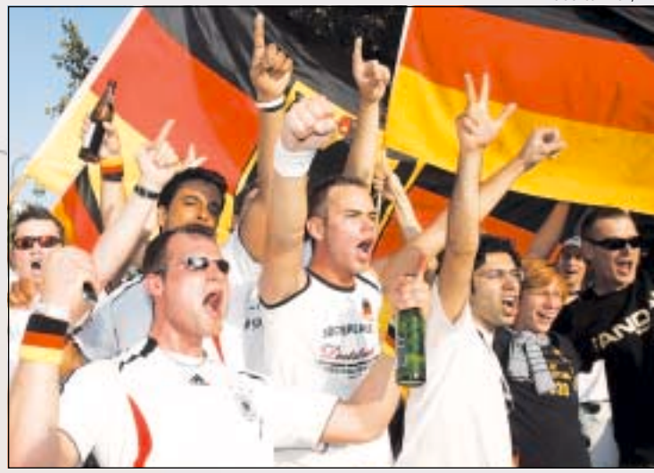
TORCIDA EM festa nas ruas de Berlim: 700 mil pessoas na Fan Mile