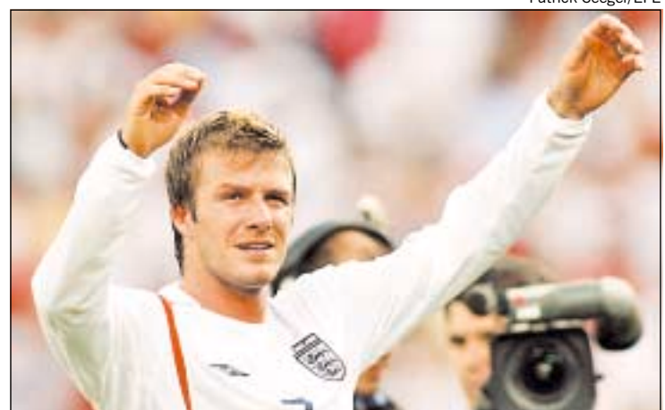
O MEIA BECKHAM: criticado pela imprensa e elogiado pela equipe